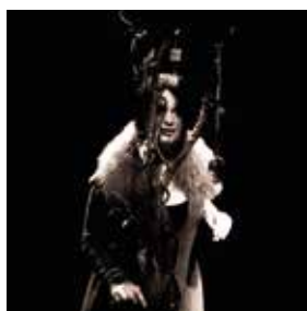
Compagnie Arc en ciel La Babayaga